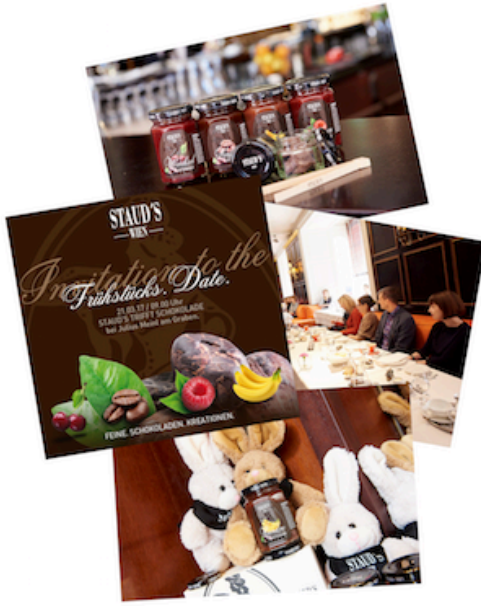
PR Event Julius Meinl