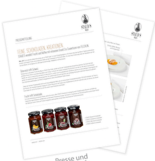
Presse und Händlerinfo