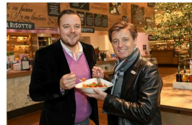
Beachvolley-Asse Doppler und Horst kochen im VAPIANO Graz für den guten Zweck

4. Mai 2017, 10:15 • Hautnah dabei sein: Am 04. Mai 2017 tauschen die Beachvolleyball-Aushängeschilder Doppler und Horst im VAPIANO Graz den Ball gegen den Pastawok und stehen Vapiano Gästen exklusiv