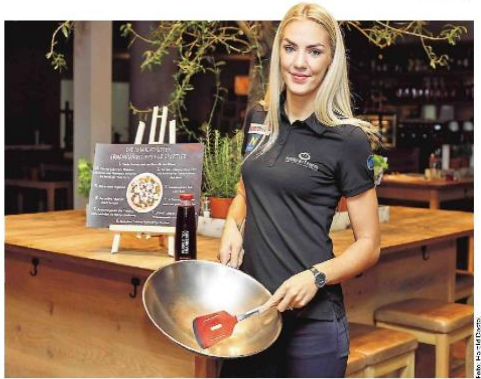
Die Top-Leichtathletin Ivona Dadic (23) kochte im Linzer Vapiano für den guten Zweck auf