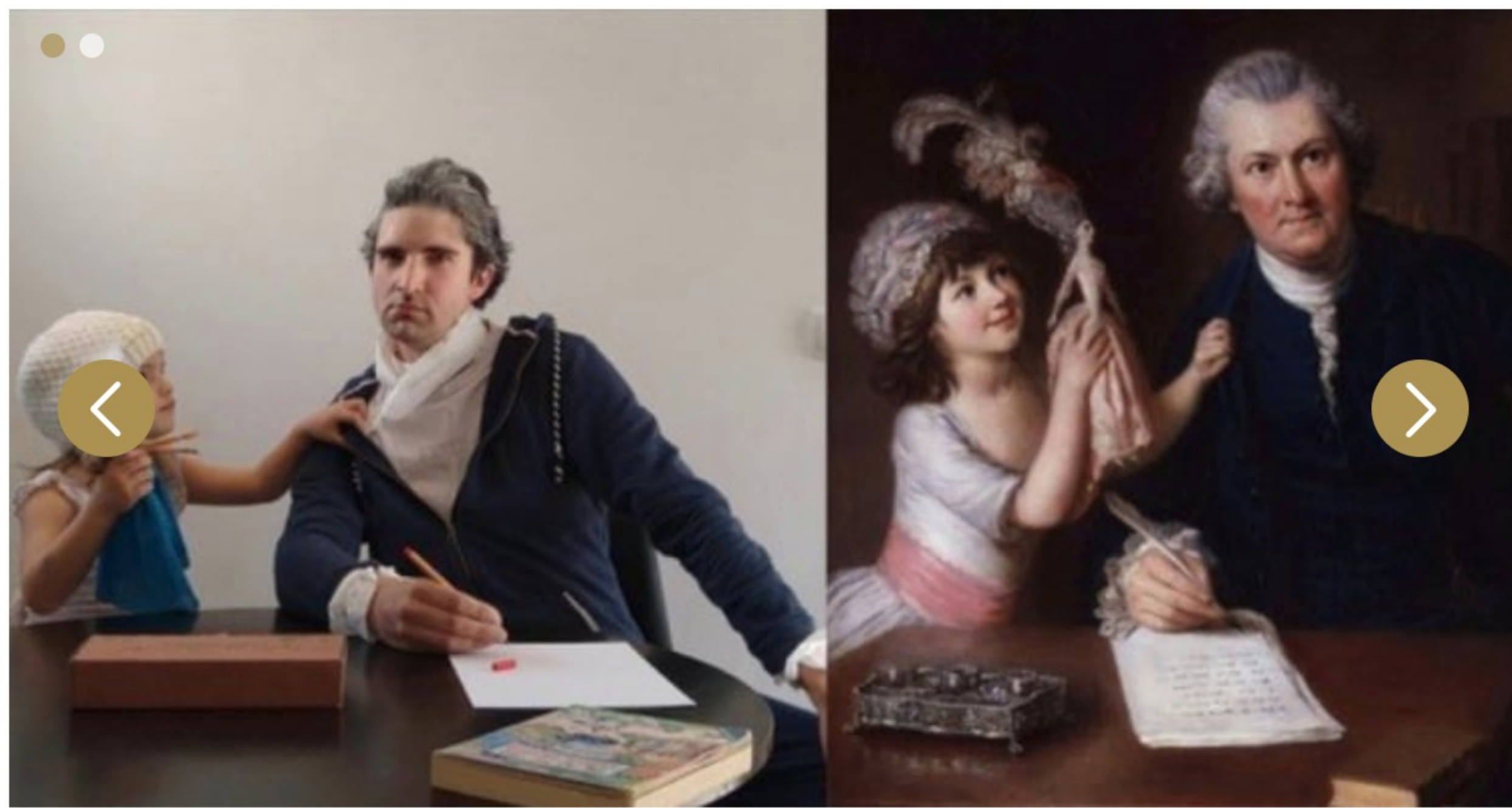
1 von 2 Bildern

#gegensteuern war für die Sozialpartner ein voller Erfolg.