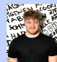
Florian Thurn Post Production