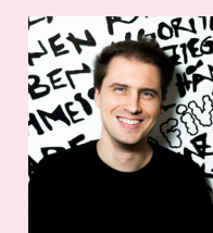
Mirko Fina Freelance Design