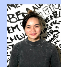
Celine Pham Post Production