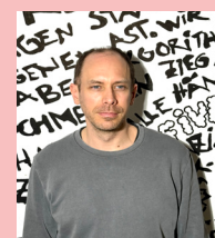
Dietmar Wilfling Text/Konzept PHOTOGRAPH